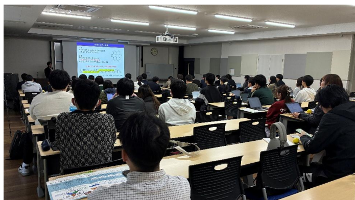
冷凍・解凍技術に関する 公開セミナー